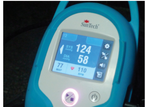
Figura 1.2. Equipo para medición de presión arterial no invasiva.

El sistema Doppler solo mide la presión sistólica. Aunque existen reportes de un cambio de sonido cuando se detecta la presión